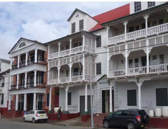
Voormalige graf Peerke Donders